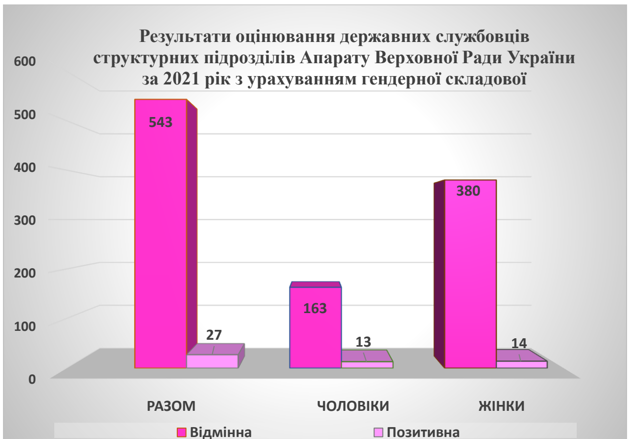
Діаграма 5. Результати оцінювання службової діяльності державних службовців структурних підрозділів Апарату за 2021 рік з урахуванням гендерної складової.