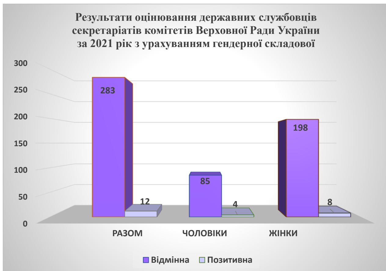
Діаграма 6. Результати оцінювання службової діяльності державних службовців секретаріатів комітетів Верховної Ради України за 2021 рік з урахуванням гендерної складової.