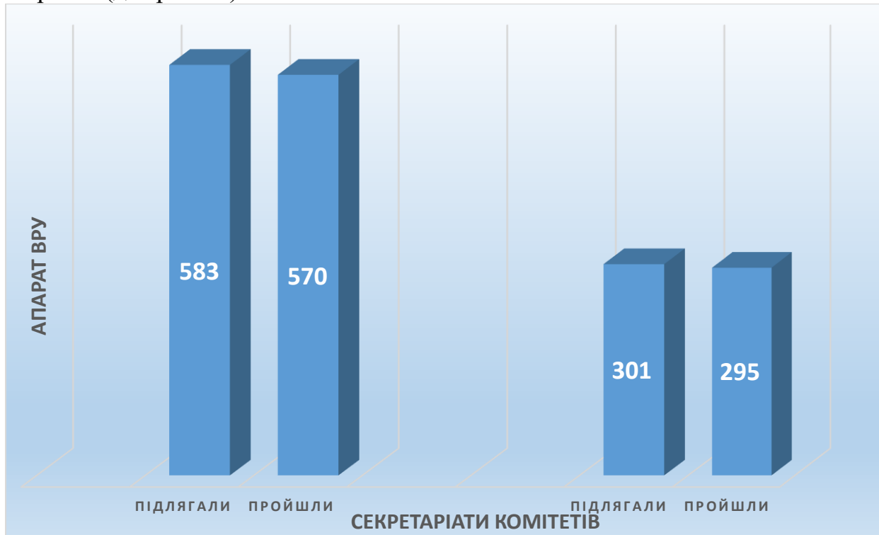
Діаграма 2. Порівняльна кількість державних службовців Апарату, які підлягали оцінюванню та які пройшли оцінювання за 2021 рік.

Станом на 21.12.2021 згідно з отриманими Управлінням кадрів заповненими Бланками, оцінювання пройшли 865 державних службовців Апарату, у тому числі 295 працівників секретаріатів комітетів Верховної Ради України (діаграма 2).