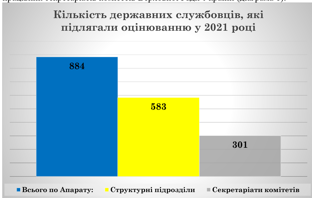
Діаграма 1. Кількість державних службовців, які підлягали оцінюванню за 2021 рік.

Станом на 06 жовтня 2021 року оцінюванню підлягали 884 державних службовців Апарату Верховної Ради України (далі – Апарат), у тому числі 301 працівник секретаріатів комітетів Верховної Ради України (діаграма 1).