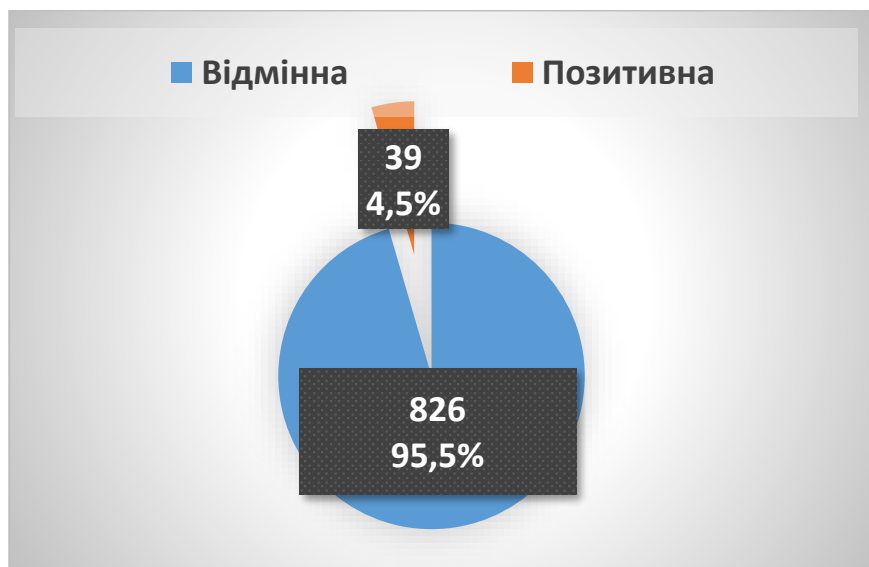
Діаграма 3. Загальна кількість отриманих оцінок державними службовцями Апарату за 2021 рік у відсотковому співвідношенні.

За результатами виконання завдань державними службовцями Апарату за 2021 рік відмінну оцінку отримали 826 осіб (95,5%) , з них 543 працівники структурних підрозділів Апарату, 283 – працівники секретаріатів комітетів Верховної Ради України; позитивну оцінку отримали 39 осіб (4,5%) , з них 27 – працівників структурних підрозділів Апарату, 12 – працівників секретаріатів комітетів Верховної Ради України (діаграми 3, 4).